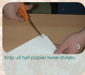
Knip uit het papier twee stukjes.