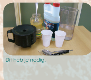
Dit heb je nodig.

Naast sap bestaat appelmoes uit clusters cellen. Als deze cellen van elkaar gescheiden worden, wordt de appelmoes dunner en ontstaat er meer sap. Vandaar dat er ook meer sap opgevangen wordt bij het gebruik van enzymen dan bij water.