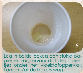
Leg in beide bekertjes een stukje papier en zorg ervoor dat de papierjes onder het vloeistofoppervlak komen. Zet de bekertjes weg.