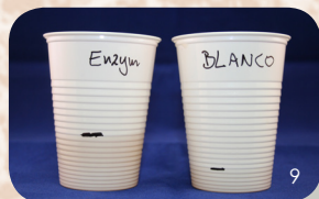
Het eindresultaat. Als je enzymproduct goed werkt, zal in het enzymbekertje veel meer sap zitten dan in het "waterbekertje", de blanco. Als het eruit ziet zoals het waterbekertje, dan werkt het slecht of niet.