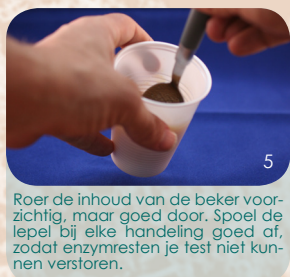
Roer de inhoud van de beker voorzichtig, maar goed door. Spoel de lepel bij elke handeling goed af, zodat enzymresten je test niet kunnen verstoren.