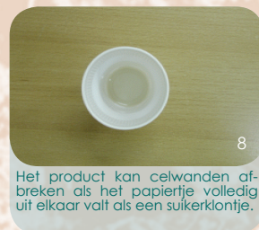
Het product kan celwanden afbreken als het papierje volledig uit elkaar valt als een suikerklontje.