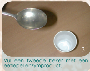
Vul een tweede beker met een eetlepel enzymproduct.