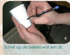
Schrijf op de bekertjes wat erin zit.