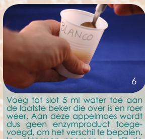
Voeg tot slot 5 ml water toe aan de laatste beker die over is en roer weer. Aan deze appelmoes wordt dus geen enzymproduct toegevoegd, om het verschil te bepalen. In vaktermen noemen we dit de "blanco". Laat de bekertjes 15 minuten staan (buiten de koelkast).