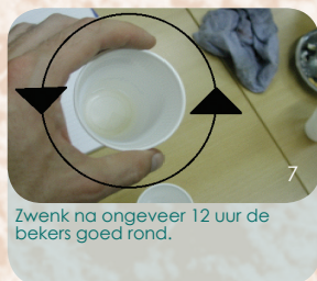
Zwenk na ongeveer 12 uur de bekertjes goed rond.