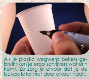
Als je plastic wegwerpbekertjes gebruikt kun je erop schrijven wat erin komt. Zo zorg je ervoor dat je de bekertjes later niet door elkaar haalt.