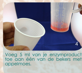
Voeg 5 ml van je enzymproduct toe aan één van de bekertjes met appelmoes.