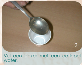
Vul een beker met een eetlepel water.