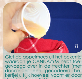
Giet de appelmoes uit het bekertje waaraan je CANNAZYM hebt toegevoegd over in de trechter (met daaronder een gecodeerd bekertje!). Kijk hoeveel vocht er door de filter druppelt. Wacht ongeveer een kwartier; het meeste vocht is er dan doorheen gelopen. Maak de vuile theedoek goed schoon als je de proef wilt herhalen. Dit geldt ook voor het bekertje waar alleen water is toegevoegd (de blanco).