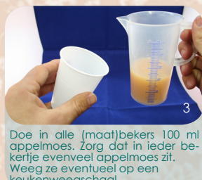
Doe in alle (maat)bekertjes 100 ml appelmoes. Zorg dat in ieder bekertje evenveel appelmoes zit. Weeg ze eventueel op een keukenweegschaal.