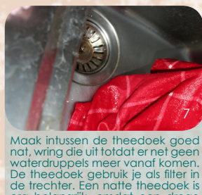
Maak intussen de theedoek goed nat, wring die uit totdat er net geen waterdruppels meer vanaf komen. De theedoek gebruik je als filter in de trechter. Een natte theedoek is erg belangrijk, omdat een droge bijna alle vocht uit je appelmoes-enzym-mengsel opneemt. Dat beïnvloedt natuurlijk je test!