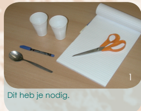
Dit heb je nodig.

Als het papierje echt niet oplost, dan heeft het geen zin om verder te gaan met de volgende proef: het appelmoesexperiment. Als je enzymproduct namelijk geen celwanden kan afbreken, dan kunnen dode plantencellen niet worden afgebroken en werkt je enzymproduct niet. Dat weet je dus al met één simpele test.